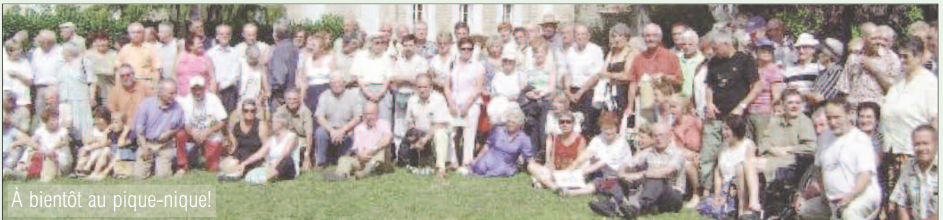
À bientôt au pique-nique!

Le Pique-nique annuel aura lieu le 2 septembre 2007 de 10 à 17 heures à l'adresse suivante :